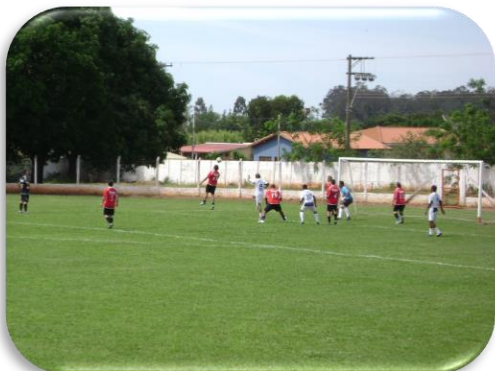
Foto 362- Futebol de Campo