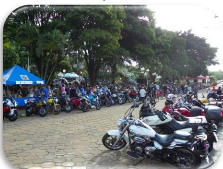
Foto 380- Praça Arlindo Eiras

Esses encontros de motociclistas e tri ciclista contam com vários shows com Bandas de Rock, expositores e lojas de acessórios para moto.