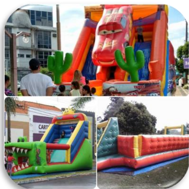
Foto 396- Fim de Ano para as crianças

Fonte- Página da Prefeitura Municipal de Lutécia no Facebook