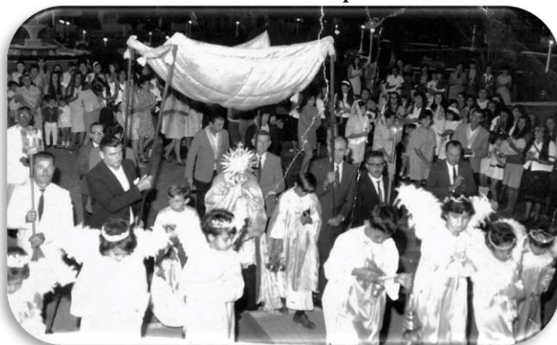
Foto 339- Procissão de Corpus Christi