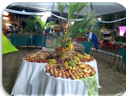
Foto 1174- Noite Havaiana