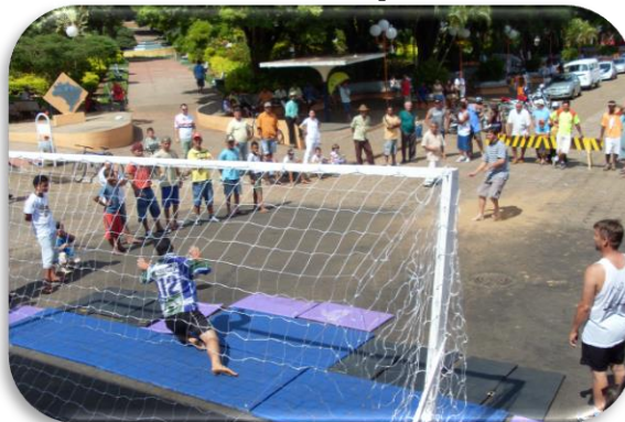
Foto 5- Cobranças de pênaltis