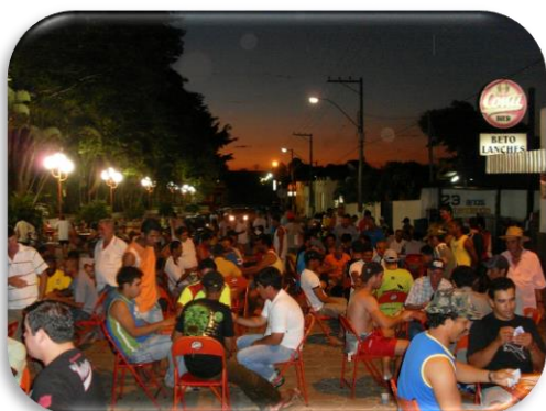
Foto 4- Torneio de Truco