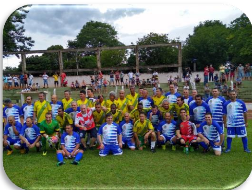
Foto 392- Futebol – Lutécia vs Seleção Brasileira Amigos do Careca