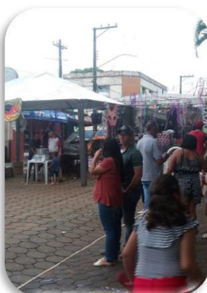
Foto 351- Carnaval na Rua