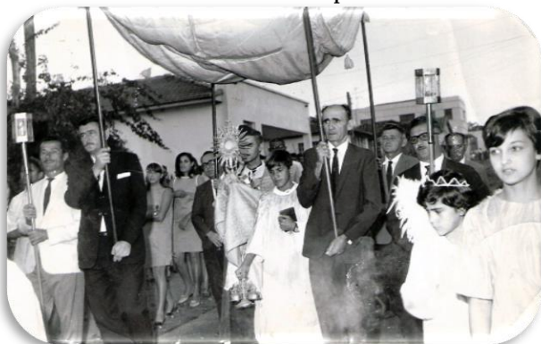
Foto 337- Procissão de Corpus Christi