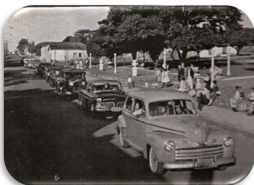
Foto 333- Procissão de São Cristóvão