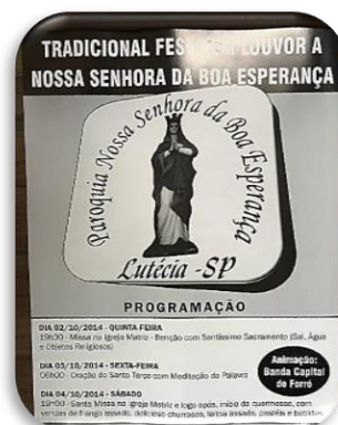
Foto 385- Cartaz

Santa Missa em Louvor a Nossa Senhora da Boa Esperança após quermesse com venda de bebidas, pasteis e assados (Frango, Leitoa e churrasco).