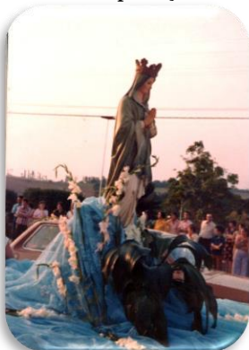
Foto 331- Procissão de Nossa Senhora da Boa Esperança