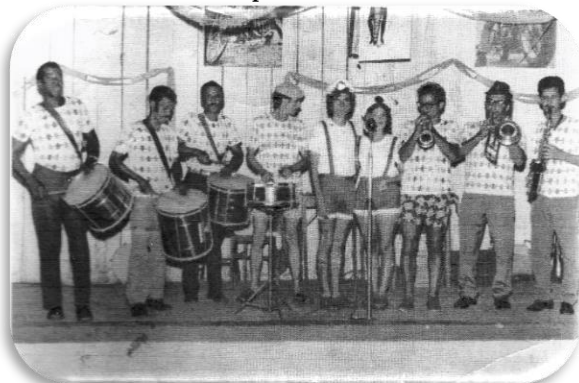
Foto 345- Imperadores do ritmo