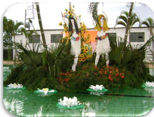
Foto 8- Baile do Havai