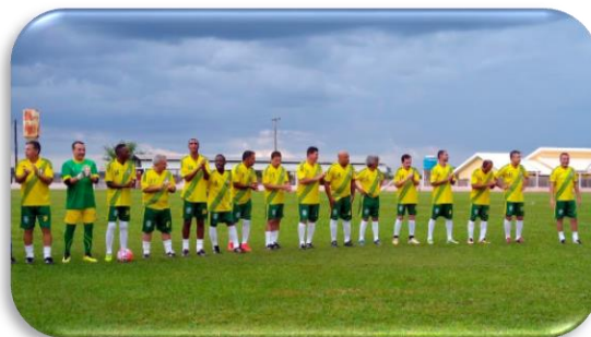
Foto 393- Lutécia vs Seleção Brasileira Amigos do Careca