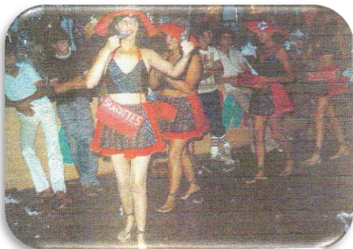
Foto 347- Bloco Sorveteria