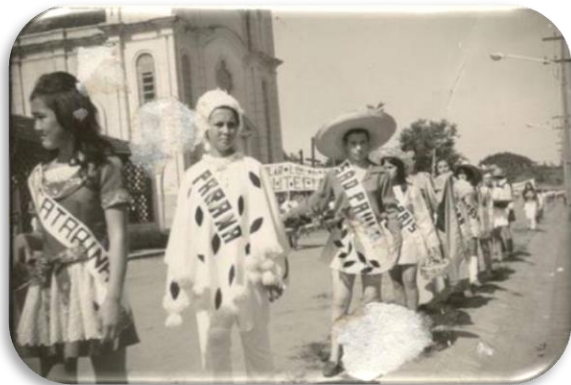
Foto 355- Desfile em comemoração ao aniversário de Lutécia