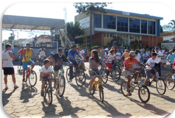
Foto 7- Ciclismo