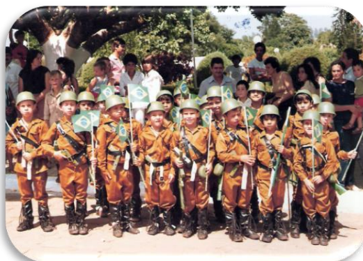
Foto 356- Desfile em comemoração ao aniversário de Lutécia