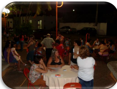
Foto 3- Torneio de Buraco