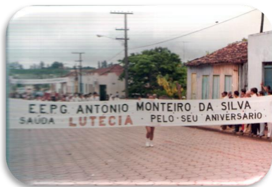
Foto 359- Desfile em comemoração ao aniversário de Lutécia