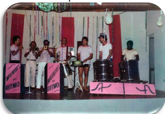
Foto 2- Imperadores do ritmo