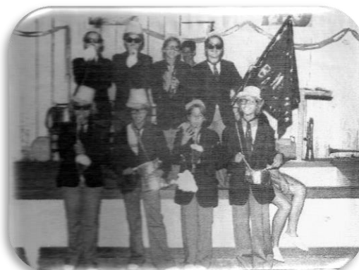
Foto 344- Banda Bandalha