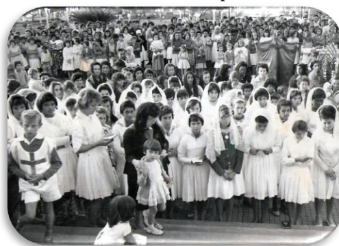
Foto 336- Procissão de Corpus Christi

O objetivo da comemoração é resgatar a entrada triunfal de Jesus Cristo em Jerusalém, dias antes de ser crucificado. A festa marca a introdução da Eucaristia nas missas. A palavra 'Corpus Christi', é de origem latina e significa 'Corpo de Cristo', que nas celebrações da Igreja Católica, é a hóstia consagrada.