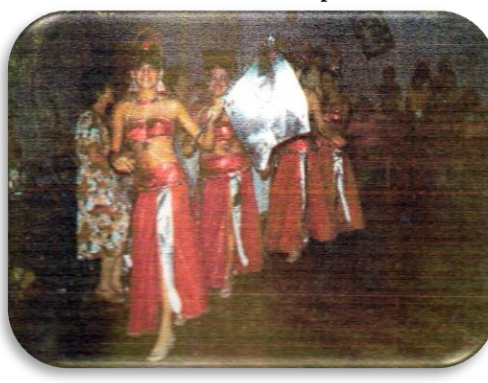
Foto 346- Bloco Cleópatra