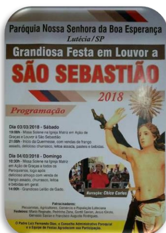
Foto 384- Cartaz

Convém destacar que o conceito de festa está associado à diversão e ao regozijo independentemente do evento em si. Por isso, existem frases como “Não vamos estragar a festa” (quando se pede a alguém para não causar distúrbios ou problemas), que se utiliza mesmo quando não se esteja no meio de um festejo.