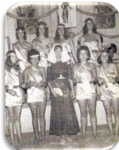
Foto 349- Bloco Escrava