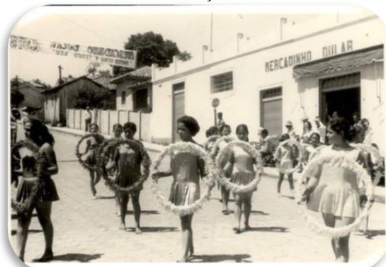
Foto 354- Desfile em comemoração ao aniversário de Lutécia