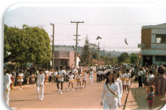
Foto 358- Desfile em comemoração ao aniversário de Lutécia