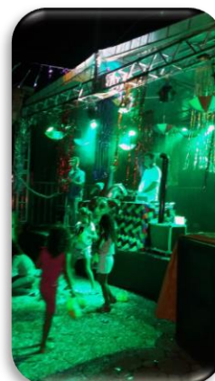
Foto 352- Carnaval na Rua