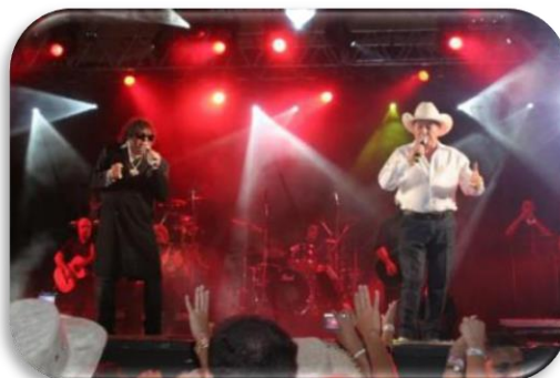
Foto 376- Shows no Estádio - Milionário & José Rico entre outros