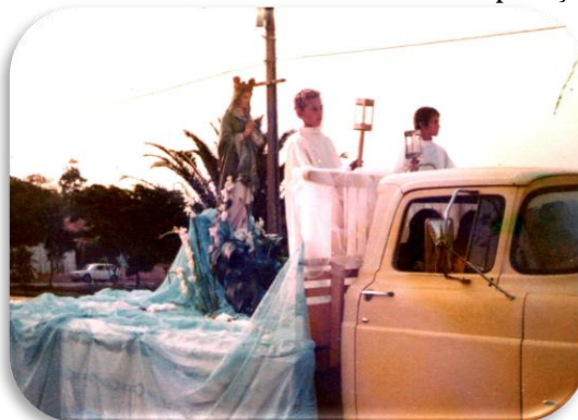
Foto 332- Procissão de Nossa Senhora da Boa Esperança