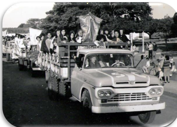
Foto 335- Procissão de São Cristóvão