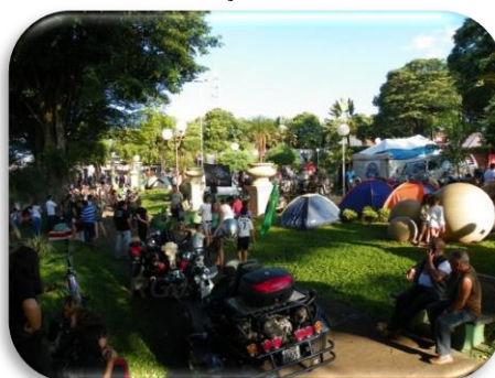
Foto 13- Praça Arlindo Eiras