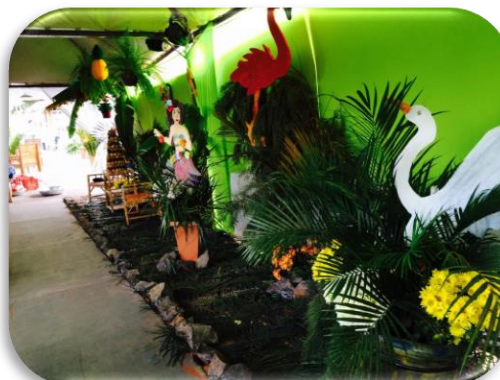
Foto 372- Baile do Havai