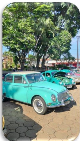
Foto 382- Praça Arlindo Eiras