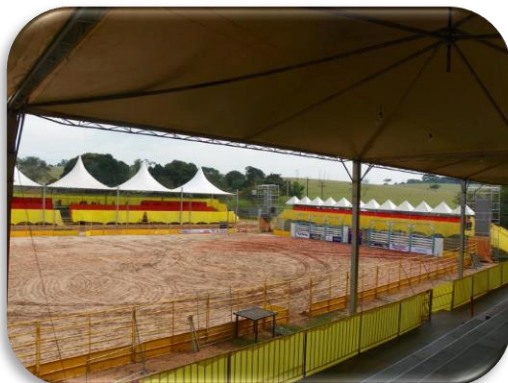
Foto 390- Festa do Peão

Sempre é realizada alguma comemoração especial para comemorar o aniversário da cidade (show na praça, festa do Peão, Almoço no Estádio).