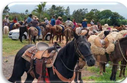
Foto 395- Cavalgada