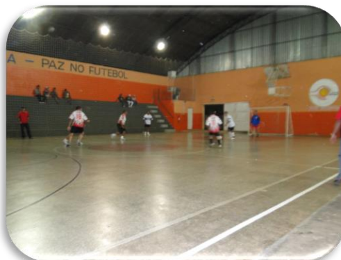
Foto 363- Futebol de Salão