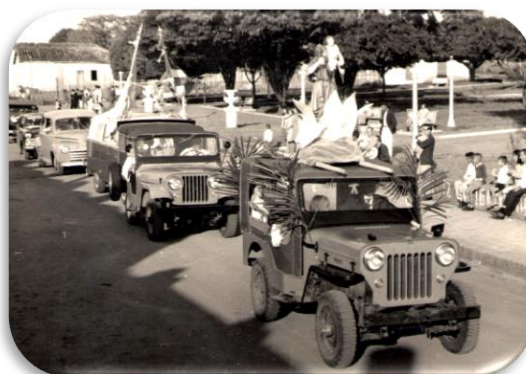
Foto 334- Procissão de São Cristóvão