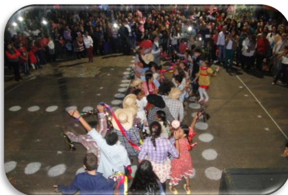
Foto 389- Integração dos Bairros