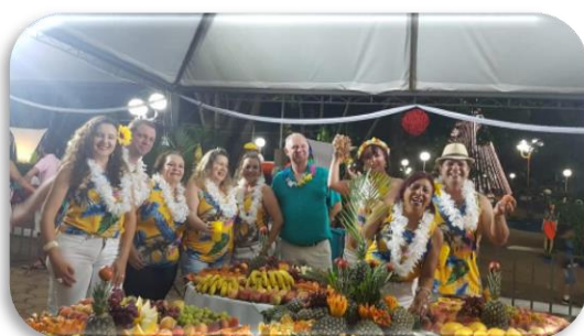
Foto 1273- Noite Havaiana