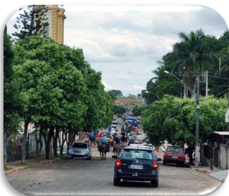
Foto 394- Cavalgada