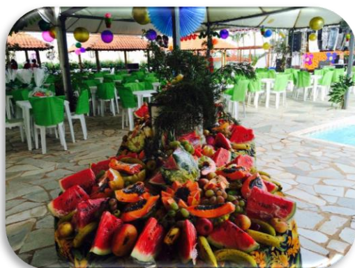
Foto 10- Baile do Havai