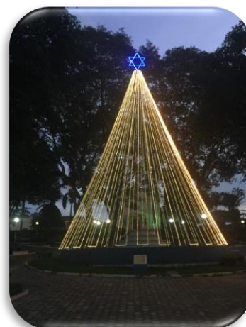
Foto 14- Fim de Ano

Realizado em praça pública com DJ, Banda ao vivo e grande queima de fogos.