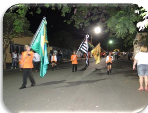
Foto 361- Desfile em comemoração ao aniversário de Lutécia