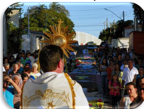
Foto 340- Procissão de Corpus Christi