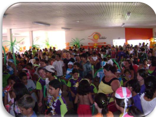
Foto 9- Baile do Havai Kids

Decoração Típica com frutas tropicais e as músicas fica por conta de DJ e Banda ao vivo.