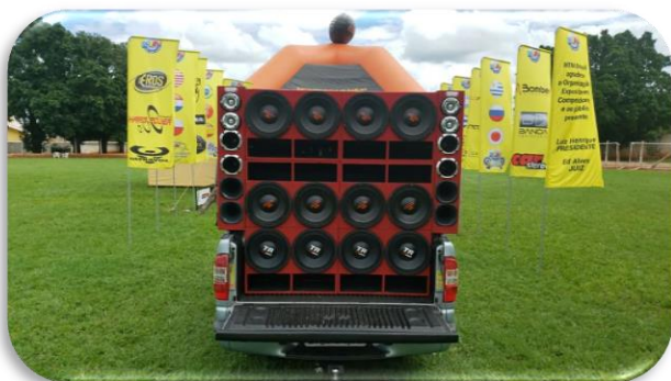
Foto 378- Campeonato Som

Fonte- Pagina da Prefeitura Municipal de Lutécia-SP no FaceBook