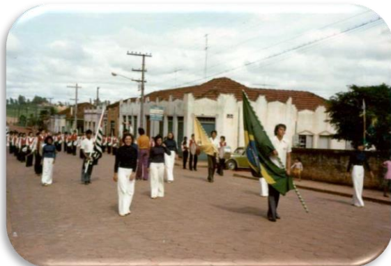
Foto 357- Desfile em comemoração ao aniversário de Lutécia