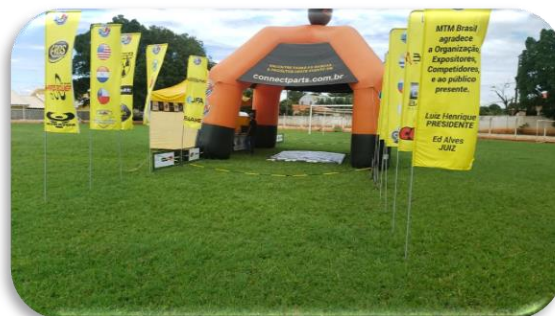
Foto 379- Campeonato de Som

Fonte- Pagina da Prefeitura Municipal de Lutécia-SP no FaceBook