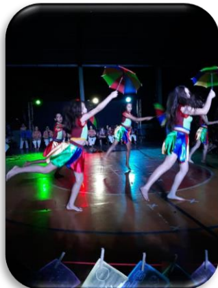
Foto 341- Sarau

Fonte- Página da Prefeitura Municipal de Lutécia no Facebook