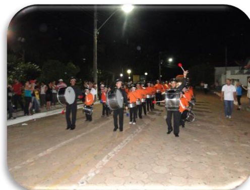
Foto 360- Desfile em comemoração ao aniversário de Lutécia