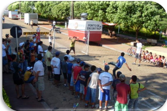
Foto 6- Cobranças de pênaltis