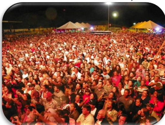
Foto 377- Shows no Estádio - Milionário & José Rico