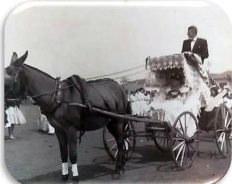
Foto 353- Desfile de 7 de setembro de 1954 em Lutécia