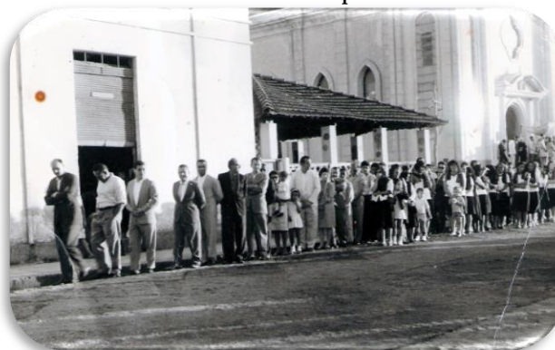
Foto 338- Procissão de Corpus Christi