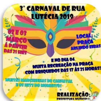
Foto 350- Cartaz